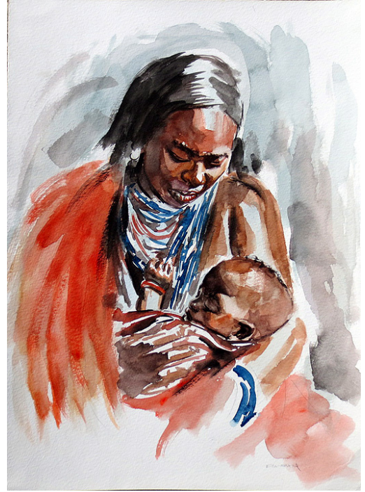
الأم الكبرى مع الطفل لوحة باتريك كينوثيا