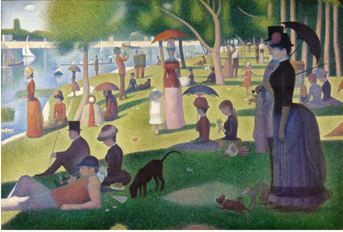
La Grande Jatte بعد ظهر يوم الأحد في جزيرة لوحة لجورج سورات